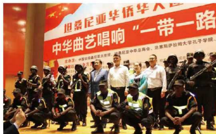
2019年8月12日，华远卫士坦桑尼亚分公司圆满完成“坦桑尼亚华侨华人迎国庆70周年庆典中华曲艺唱响‘一带一路’专场演出晚会”

保障任务，受到海外华人华侨的广泛关注，得到中国驻坦桑尼亚使馆王克大使、中国曲艺家协会主席著名相声表演艺术家姜昆老师的认可和表扬！