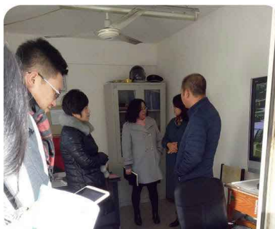
2016年11月市文明办，三年攻坚小组，房管局，区妇联，现场对小区进行评选

地税小区是一个普通的职工住宅小区，位于沙日乌素路14号，于2006年交付使用，占地面积2.2万平方米，建筑面积2万平方米，总栋数7栋，17个单元，住户148户，车库130个。