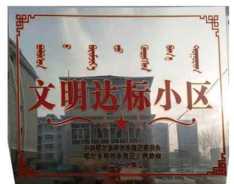
政府颁发“文明达标”奖状